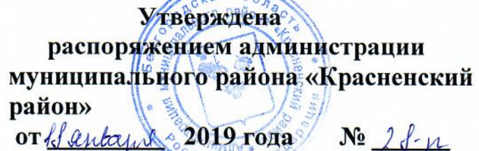
Схема размещения нестационарных торговых объектов на территории Красненского района: с. Красное, ул. Октябрьская, (площадь) в 2019 году